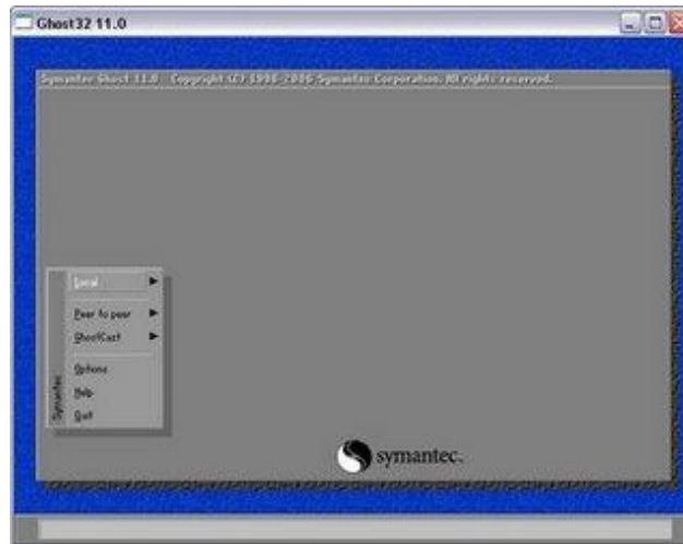
Schermata iniziale del Norton Ghost