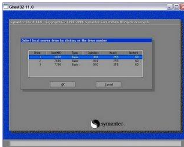
Schermata di selezione disco

Alla fine compare la schermata che chiede di procedere con il dump (la copia dell'immagine). Selezioniamo High come compressione ed aspettiamo che finisca.