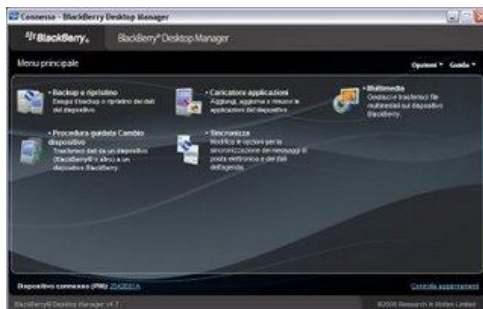
BlackBerry - Desktop Manager