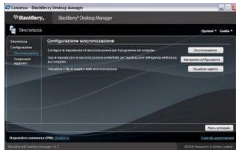
BlackBerry - Desktop Manager - Sincronizzazione - 2

9 - Nella schermata successiva cliccare su Sincronizzazione sotto Configurazione