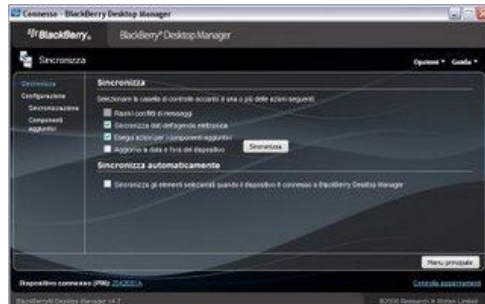
BlackBerry - Desktop Manager - Sincronizzazione - 1