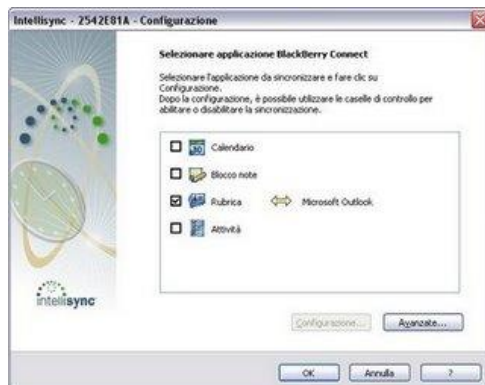
BlackBerry - Desktop Manager - Sincronizzazione - 3

10 - Cliccare sul pulsante bianco Sincronizza . A questo punto il PC farà una serie di schermate di allineamento. Non preoccupatevi, serve solo al cellulare e al PC per allinearsi. Comparirà la seguente schermata